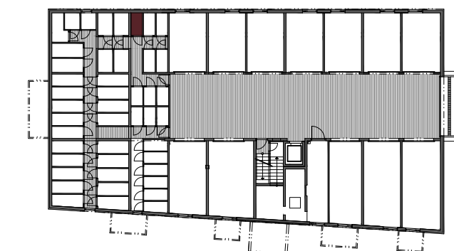
PIVNICA Č. 27